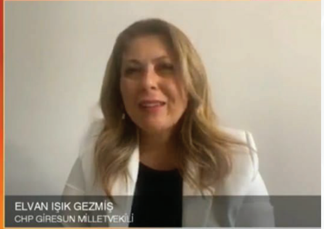
ELVAN IŞIK GEZMİŞ CHP GİRESUN MİLLETVEKİLİ